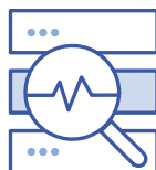
Audits et conformité réglementaire