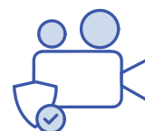
Surveillance de session priviligée

Une solution d'entreprise prête pour les administrateurs de sécurité pour permettre un accès direct et granulaire aux systèmes critiques couvrant l'ensemble de l'infrastructure et gérer les sessions privilégiées avec des contrôles d'audit en temps réel.