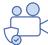
Monitoreo de sesiones privilegiadas

Una solución lista para empresas para que los administradores de seguridad habiliten el acceso directo y detallado a sistemas críticos que abarcan toda la infraestructura y para gestionar sesiones con controles de auditoría en tiempo real.