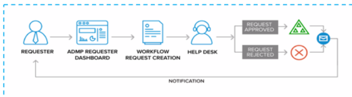
Figura 1. Uma visão geral do recurso Business Workflow no ADManager Plus.

O workflow de aprovação no ADManager Plus oferece uma solução rápida para muitos dos desafios diários do help desk. O módulo de workflow agora oferece um painel simplificado para solicitantes autorizados iniciarem solicitações de gerenciamento de usuários, grupos, computadores, contatos e permissões.